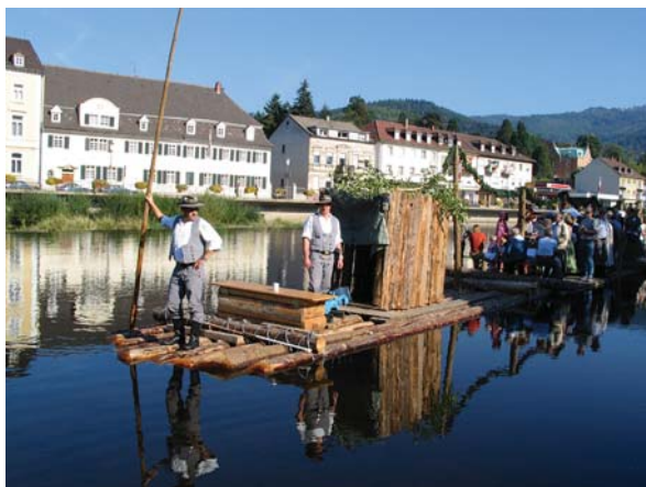
Floßfahrt beim Gernsbacher Altstadtfest

Der AKF Stadtmarketing organisiert für Sie kostenfrei Tages- und Mehrtagesaufenthalte in Gernsbach wie auch Fahrten in die Umgebung individuell nach Ihren Wünschen.